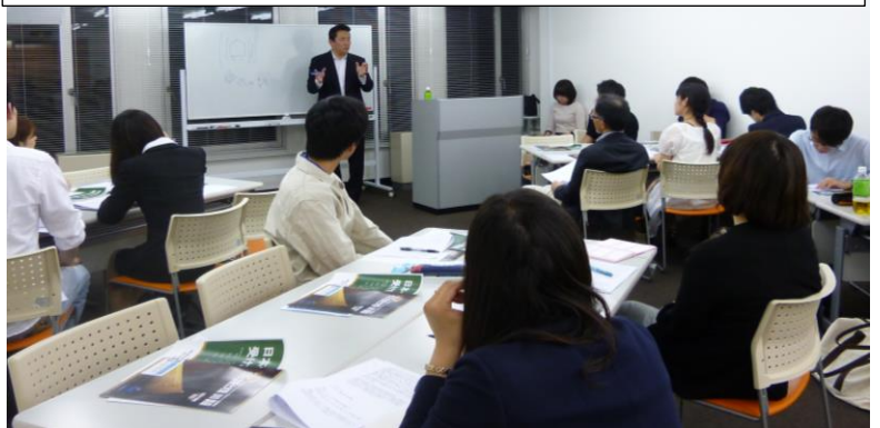
5月8日開催の1限目「明治神宮創建からみる日本人の気概」

若者の関心が高いと想定される日本の文化・魅力、ならびにこれらをリスクマネジメントの視点から学ぶ機会とし、若者の学習意欲の向上と日本文化の継承を図ります。毎回の授業で30名の参加、年間延べ100名の受講を目指します。